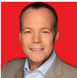
Dr. Matthias Miersch, MdB Vorsitzender des Unterbezirks Region Hannover